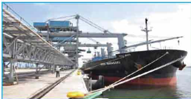
Coal unloading at CICTPL Terminal

Your Company had signed a License Agreement for handling coal to the consumers other than TNEB, on a 30 year BOT basis, in September 2006 with the project company Chettinad International Coal Terminal Pvt. Ltd (CICTPL) with an approved project cost of Rs.399.13 crores. The Licensee has developed a terminal with a cargo handling capacity of 8 MTPA. The commercial operations began from 11 th March 2011. During the financial year 2012-13, CICTPL handled 5.05 MT of Non-TNEB coal.