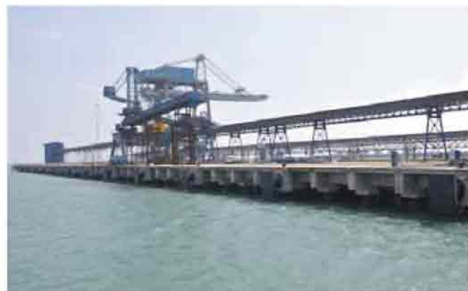
View of Iron Ore Berth with Ship Loader & Conveyor System

Your company had signed an agreement for an Iron Ore terminal on a 30 years BOT basis on 23 rd September 2006 with the project company SICAL Iron ore Terminal Limited with an approved project cost of Rs.480 crores in two phases of 6 million tonnes each. The Licensee has developed the first phase of 6 MTPA capacity at an investment of Rs. 360 crores. The commissioning activities depend on the permits on the movement of export of Iron Ore by State Government of Karnataka and the Hon'ble Supreme Court. Your company in consultation with the licensee has been exploring the possibility of handling alternative cargo at the Iron Ore berth.