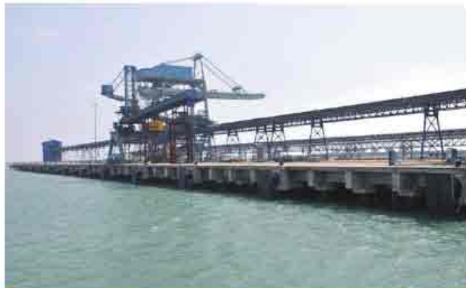
पोत योटर और कन्वेर सिस्टम के साथ मोह आयरन शयका का नजारे।

अनुमोदित परियोजना रु. 480 करोड़ की लागत में 30 वर्षों के लिए बीओटी आधार पर अयस्क लोहा टर्मिनल के विकास हेतु 23 सितंबर, 2008 को एसआईसीएल अयस्क लोहा टर्मिनल लिमिटेड के साथ अधिकृत करार पर हस्ताक्षर किया गया, जो 6 मिलियन टन प्रत्येक के हिसाब से दो स्थलों पर था। अधिकृत करार के मुताबिक प्रथम चरण में रु. 380 करोड़ की लागत से 6 एमपीटीए की क्षमता बढ़ाना है। किंतु अयस्क लोहा आयात के प्रचालन के कार्यक्रम कर्नाटक सरकार और उच्चतम न्यायालय की अनुमति पर आधारित है।