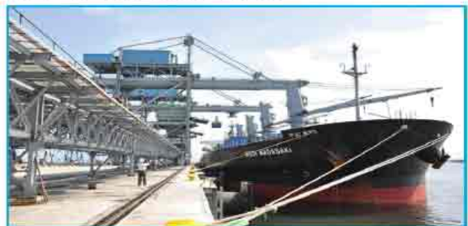
सीआईसीटीपीएल टर्मिनल पर कोयला उतारा जा रहा है।

अधिकृत 8 एमटीपीए क्षमता का एक टर्मिनल विकसित किया गया है। वाणिज्य परिचालन 11 मार्च 2011 से शुरू हो चुका है। वित्त वर्ष 2012–13 के दौरान के प्रचालन में सीआईसीटीपीएल ने नॉन टीएनईबी कोयले के 5.05 एमटी लाख टन कोयले को निपटाया है।