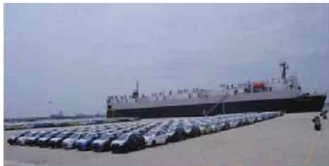
Car Export Operation at General Cargo Berth

of capacity of 8,000 cars. Further it has a back-up area of about 1,41,000 sq.m with an expansive car parking yard for 10000 cars which is the largest facility in any Indian Port. During the year under review, the terminal exported 1,44,685 cars, 256 buses/trucks and imported 110 Sports Utility Vehicles and 2 Volvo buses.