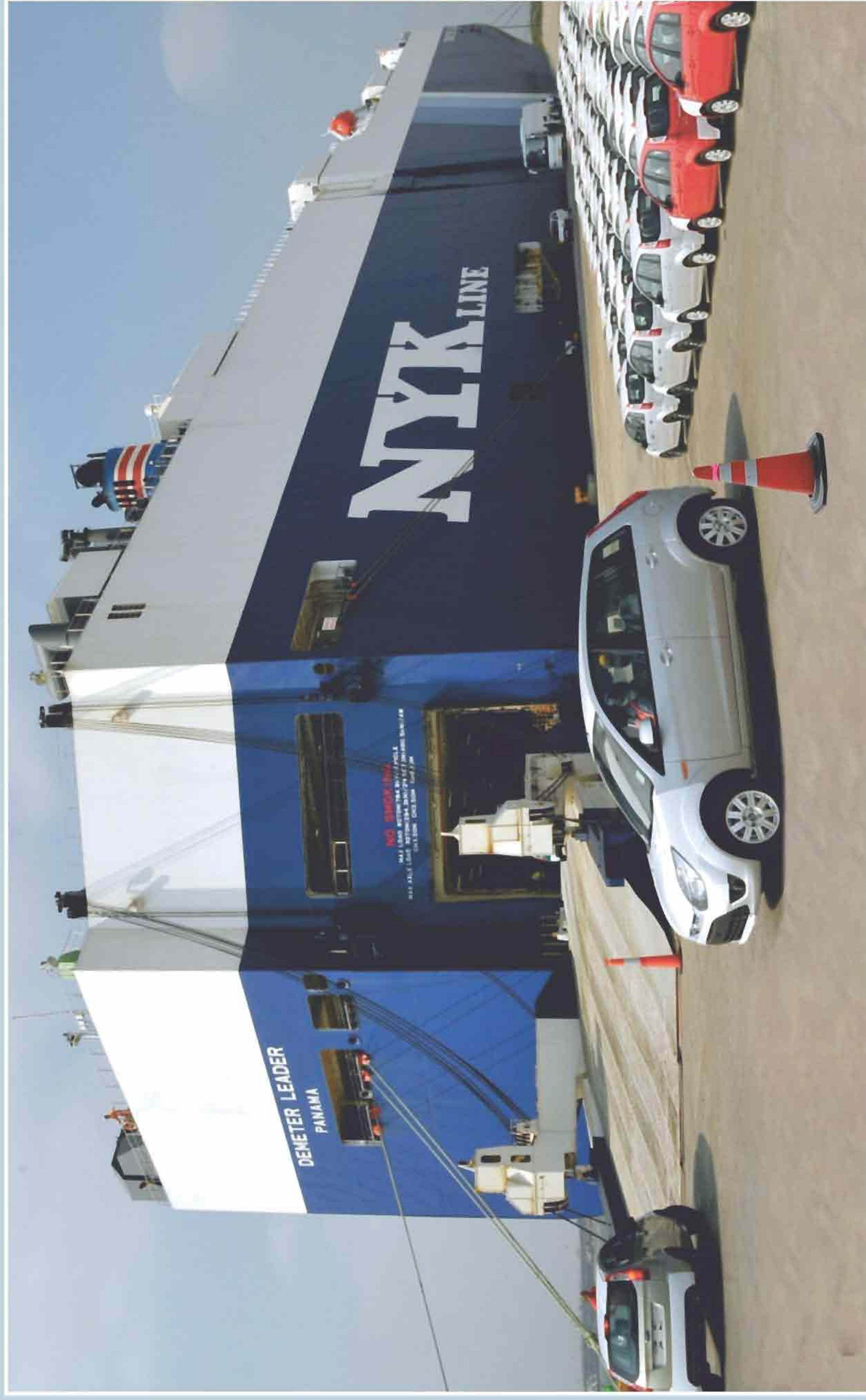
Panoramic View of General Cargo Berth with Transit Car Parking