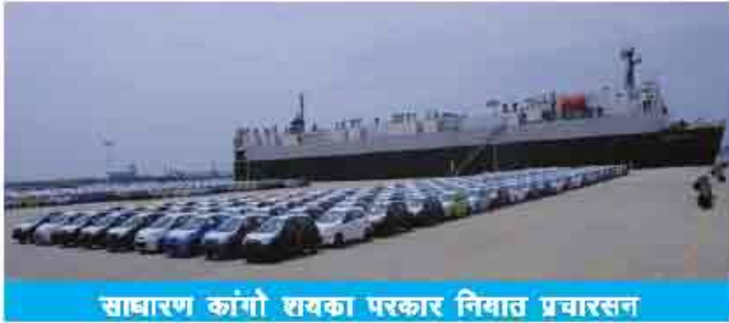
साधारण कांठो शयका परकार निवात प्रचारसन